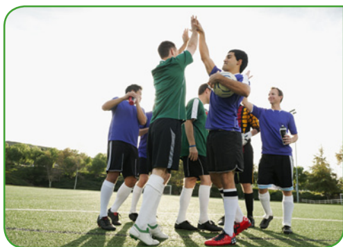
Die active bleibt cool, auch wenn das Spiel hitzig wird.

Fast schon ein zusammenklappbarer Kühltank unsere active – Ihr idealer Begleiter an heißen Sommertagen.