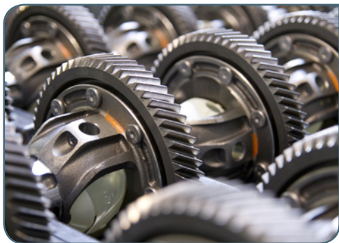
Die universal logistics verzahnt Zulieferer und Hersteller reibungslos.